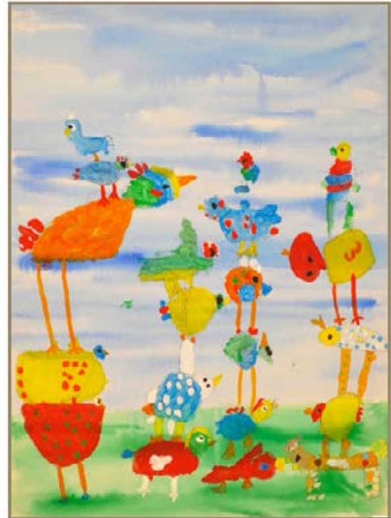
Stapelvogels 2005, 10-12